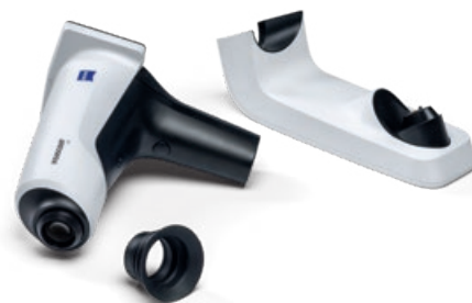
ZEISS VISUSCOUT 100: captura de imágenes portátil y flexible