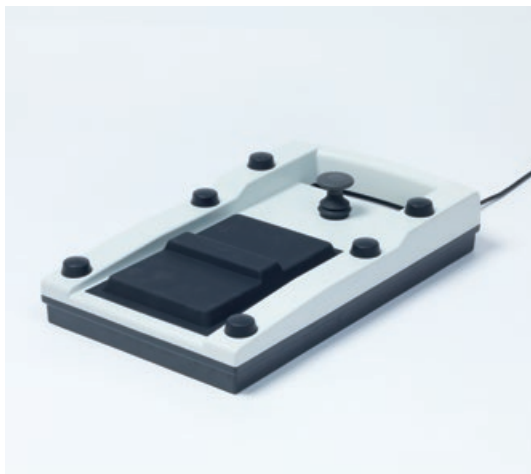
Panel de pedal ergonómico

Microscopio de asistente, cámara HD, sistema de reproducción del fondo ocular ZEISS RESIGHT 500: todas las piezas y accesorios están totalmente integrados, sea cual sea la configuración. Además, al usar el cómodo y ergonómico panel de pedal puede concentrarse en sus intervenciones sin distracciones ni interrupciones.