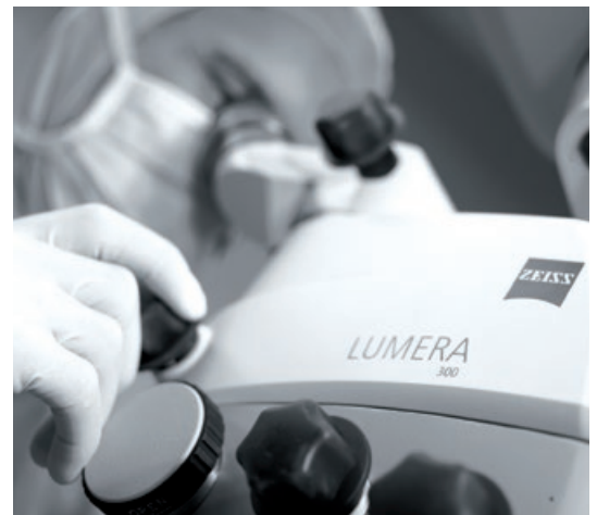
Pruebe una calidad excepcional

Y con los paquetes de servicio OPTIME de ZEISS que incluyen desde el mantenimiento preventivo al correctivo, así como piezas de repuesto, puede contar con la máxima disponibilidad del sistema y comodidad.